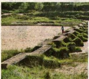
▲橋樑連接兩岸，方便村民過河和學生上學，義工的小小付出卻提供了大大的方便。