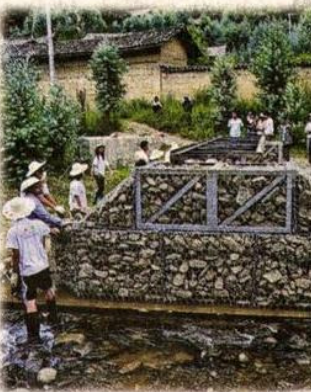
▲橋身看似簡單，甚至有些粗糙，但卻是堅固、實用及成本低的便橋。