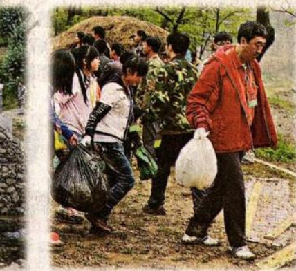
▲沈校長和一群學生無分彼此，無分階級，一同服務村民。